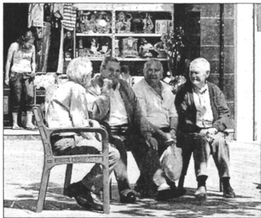
Un grup de veïns de Sant Celoni fent petar la xerrada a la plaça de la Vila

Alguns veïns prefereixen no pensar en les eleccions, simplement perquè "no els