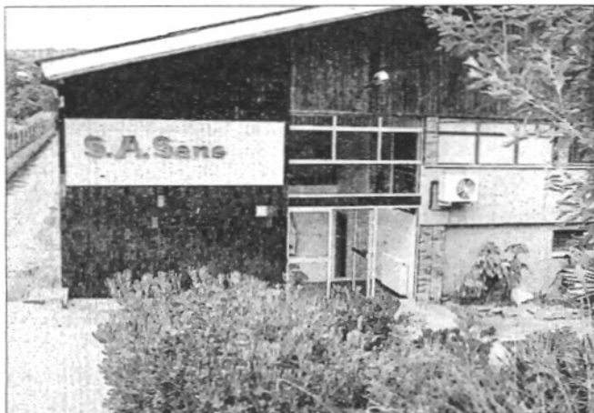
Sans va tancar l'any 1996 a Palautordera, amb 230 acomiadats i efectes sobre diverses indústries