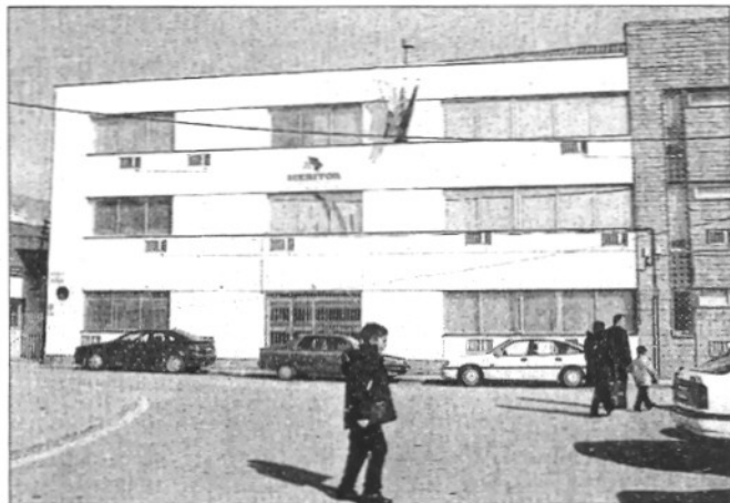
Arvin Meritor va traslladar l'activitat al Baix Llobregat i va tancar la planta de Palautordera