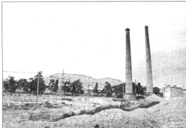
Les instal·lacions de Pàmies a Sant Celoni s'han enderrocat per possibilitar la construcció de 30 naus