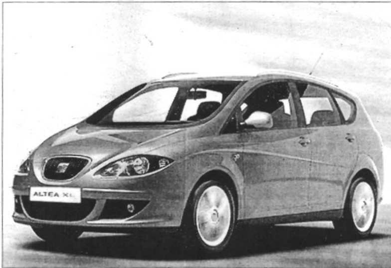
El Seat Altea XL és un dels atractius que es podrà trobar a l'espai de Celomóvil

El primer és un vehicle amb un disseny molt nou molt apropiat per a tothom que vulgui comoditat al volant. És dinàmic, emocional, actiu i esportiu a la vegada. El sistema de regulació i posició dels seients Varioflex contribueix a aprofitar al màxim l'espai interior del vehicle. L'Audi Q7 utilitza el sistema de tracció de quatre rodes. La base mecànica d'aquest sistema consisteix en una sèrie de bloquejos electrònics que aprofiten la potència del motor fins i tot quan una roda patina o deixa d'estar en contacte amb el terra, i la reparteix de mane-