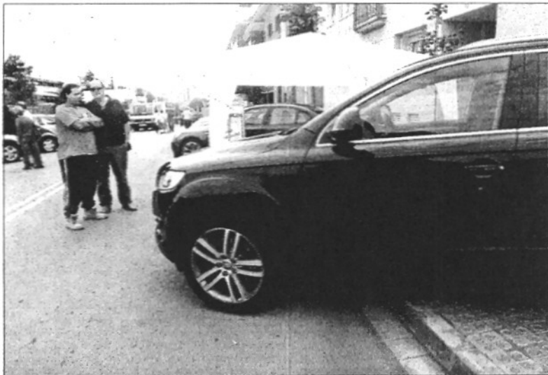
Una imatge de la Fira del Vehicle d'Ocasió, que ha aconseguit ser un èxit de visitants i vendes

El sector automobilístic de Sant Celoni és un dels més importants del Vallès Oriental. Aquesta realitat és un dels punts forts que han estat determinants per tirar endavant la iniciativa. Participaran en la fira 12 concessionaris, el que suposa el 80% de les empreses del sector automobilístic de Sant Celoni. L'objectiu de les Botigues al Carrer és promocionar el comerç del municipi. En canvi, les fires de vehicles