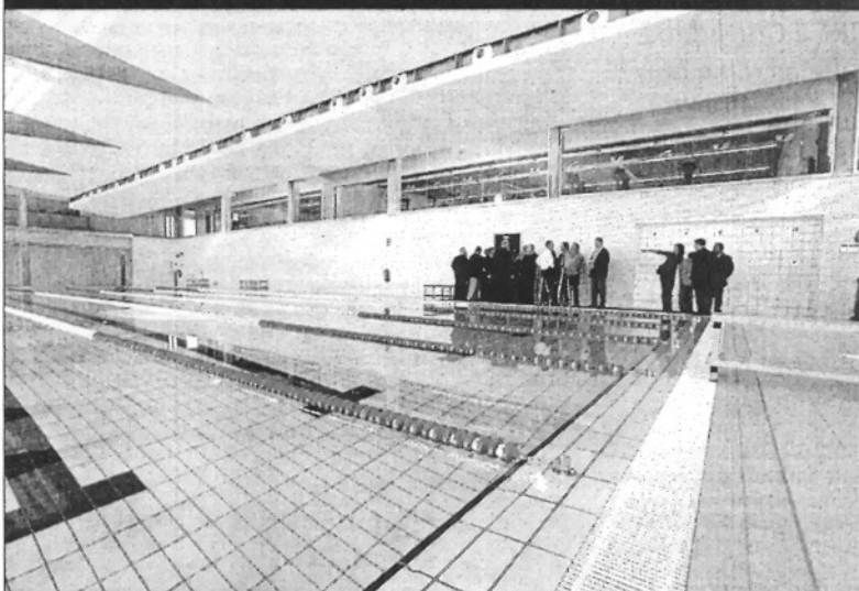
La piscina coberta del Sot de les Granotes s'ha posat en marxa aquesta legislatura