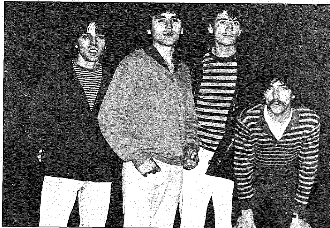
Carbonilla va viure el moment de màxima esplendor entre el 1975 i el 1982