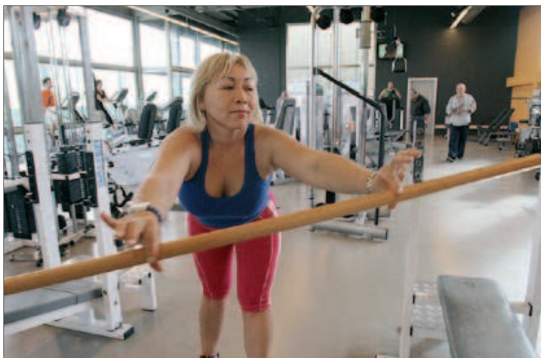
La sala de musculació del complex El Turó s'ha traslladat a una sala més lluminosa aprofitant el tancament d'un mes

Castaño havia anunciat diverses vegades, la darrera en el ple ordinari de finals de setembre a pregunta de treballadors municipals, que no renunciaria a la paga extra de Nadal, que suposa aproximadament un 7% del sou total, perquè s'havia aplicat una reducció d'un 10% del sou per l'acord de pressupost de 2012 amb la CUP. Aquest any, però, la rebaixa no és d'un 10% perquè s'ha començat a aplicar al mes de setembre, quan el pressupost s'ha aprovat definitivament. Castaño és l'únic càrrec del govern amb aquesta retribució.