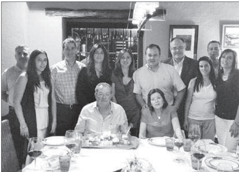
Badia va commemorar l'efemèride amb un dinar amb tots els treballadors