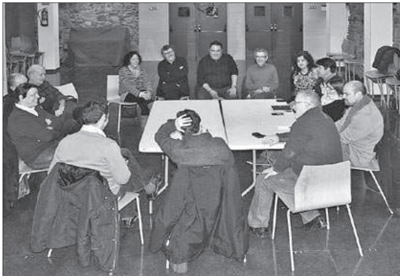
La primera reunió de Nova Esquerra Catalana a la comarca es va fer dissabte a Sant Celoni