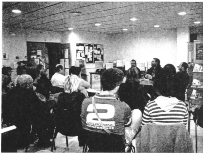
Una trentena de persones presents a la conferència inaugural

La Rentadora acull el nou Telecentre que ha posat en marxa l'Ajuntament