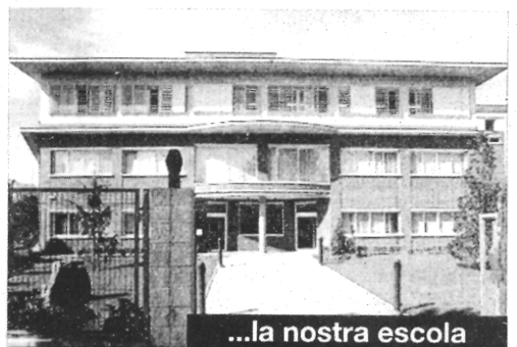
...la nostra escola