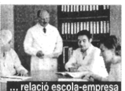
... relació escola-empresa