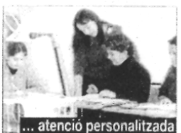
... atenció personalitzada