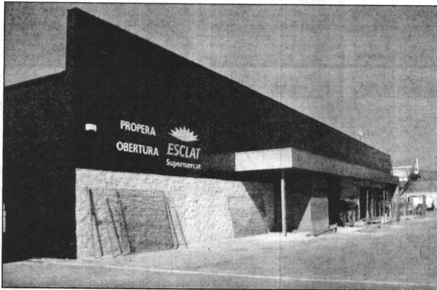
El nou Esclat de Sant Celoni està situat a l'antic Intermarché (L'AdBM)

El nou hipermercat, que ocupa l'espai on anteriorment hi havia situat l'Intermarché, comptarà amb una superfície de 1.500 metres quadrats per a l'exposició dels productes i de 7 caixes de sortida. L'establiment comptarà amb totes les seccions de fresc que li són pròpies, com xarcuteria, peixateria, formatgeria i embotits, a més d'un espai de dietètica amb productes especialment destinats a persones