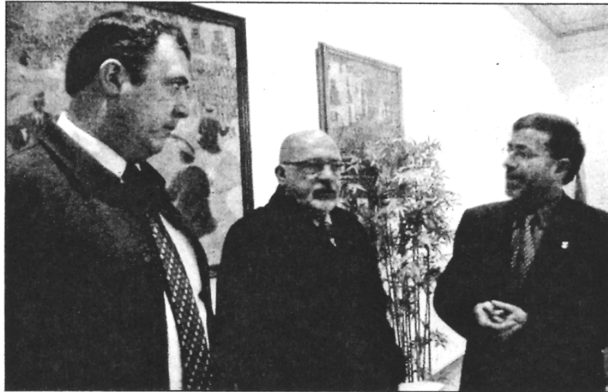
Un moment de l'entrevista de l'alcalde amb el conseller

Malgrat això, però, l'Ajuntament de Sant Celoni no està disposat a llançar la tovallola i vol seguir treba-