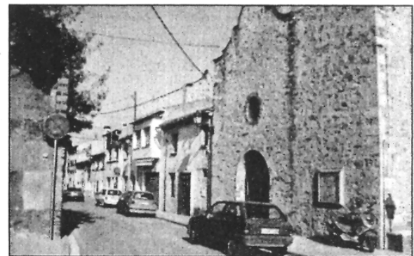
L'anàlisi dibuixa diversos escenaris possibles (L'AdBM)

REDACCIÓ. Sant Celoni L'Ajuntament de Sant Celoni presentarà el proper dijous, dia 1 de març, als veïns de la Batllòria, el Pla de sostenibilitat que ha elaborat el Consistori i que analitza diversos paràmetres de futur del poble. L'anàlisi consta de diferents estudis i inclou des d'un DAFO sobre possibilitats i febleses, un informe sobre la situació i projecció de prestació de serveis, diferents escenaris de desenvolupament de població, i diferents possibles models d'organització territorial que presenten diverses alternatives institucionals. Enre els documents també