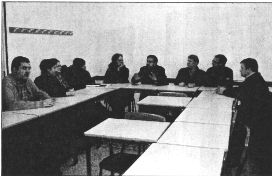
Una imatge de la reunió celebrada aquest dimecres (L'ADBM)

A Sant Celoni, actualment, cursen el PTT 18 nois i 12