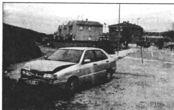
Els dos vehicles van ser retirats, dijous, després que aquest setmanari es va interessar per l'abandonament

REDACCIÓ. Sant Celoni El carrer Minuart i la plaça de les Dones són els dos punts de Sant Celoni on apareixen més vehicles abandonats. En concret, en menys d'un any, al carrer Minuart s'han retirat almenys un parell de vehicles més com els dos que els veïns van denunciar la setmana passada que els Mossos d'Esquadra havien abandonat al carrer, del costat de la comissaria.