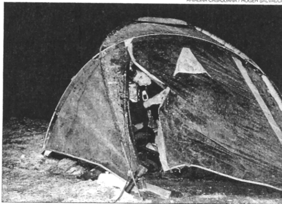
▶▶ Dos escoltes a l'interior de la tenda, ahir a la matinada.

TRAVESSA A PEU / El grup pertanyia a l'Agrupament Escolta i Guia Mossèn Puig i Moliner del barri de Sants de Barcelona i tenia previst efectuar a peu, durant el cap de setmana, la ruta Matagalls-Pla de la Calma. Dissabte van sortir de Sant Marçal, van fer una part del recorregut i van dormir